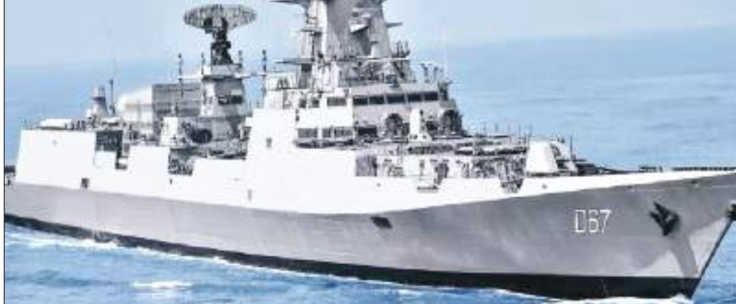
एमवी केम प्लूटो पर हुआ था ड्रोन से हमला

नेशनल मैरिटाइम एजेंसी भी नजर रख रही है: जिन तीन वॉरशिप की निगरानी के लिए लगाया गया है, उनमें आईएनएस कोच्चि, आईएनएस कोलकाता और आईएनएस मोरमुगाओ शामिल हैं। यह तीनों वॉरशिप स्ट्रीथ गार्डेट मिसाइल डिस्ट्रॉयर हैं यानी मिसाइल हमलों को नाकाम करने की क्षमता रखते हैं। ऐसे में